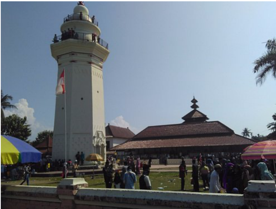
Gambar 3 Kesultanan Banten Sebelum di Revitalisasi

informal, dengan memudarnya arti penting kawasan Banten lama. Ditambahkan ke ini adalah ketidakcocokan fungsi di setiap gedung di kabupaten Banten lama seperti Keraton Surosowan dan Benteng Spellwijk. Kondisi Jika tidak ditangani, itu menjadi ancaman bagi keberlanjutan Cagar budaya di kawasan Banten lama. Unik Warisan budaya diselamatkan melalui tindakan penataan kawasan melalui program revitalisasi.