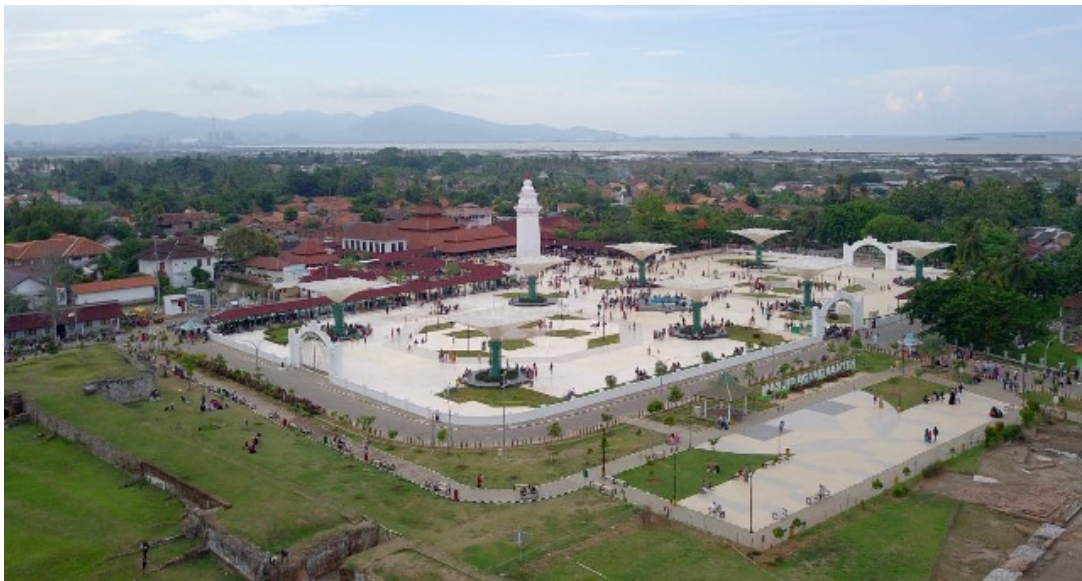
Gambar 4 Kesultanan Banten Setelah di Revitalisasi ( https://www.tangerangekspres.co.id/wp-content/uploads/2020/11/BANTEN-LAMA.jpg )

Bangunan cagar budaya yang berada pada Kawasan Kasultanan Banten sudah berumur 50 tahun keatas. Berikut merupakan bangunan cagar budaya yang terdapat pada Kawasan Kasultanan Banten dan sudah ditetapkan oleh Undang – undang Cagar Budaya Tahun 1998 sebagai bangunan cagar budaya yang berada pada Kawasan Kasultanan Banten: a) Istana Keraton Surosowan b) Istana Keraton Kaibon c) Masjid Agung Banten d) Vihara Avalokitesvara e) Benteng Spellwijk f) Museum Situs.