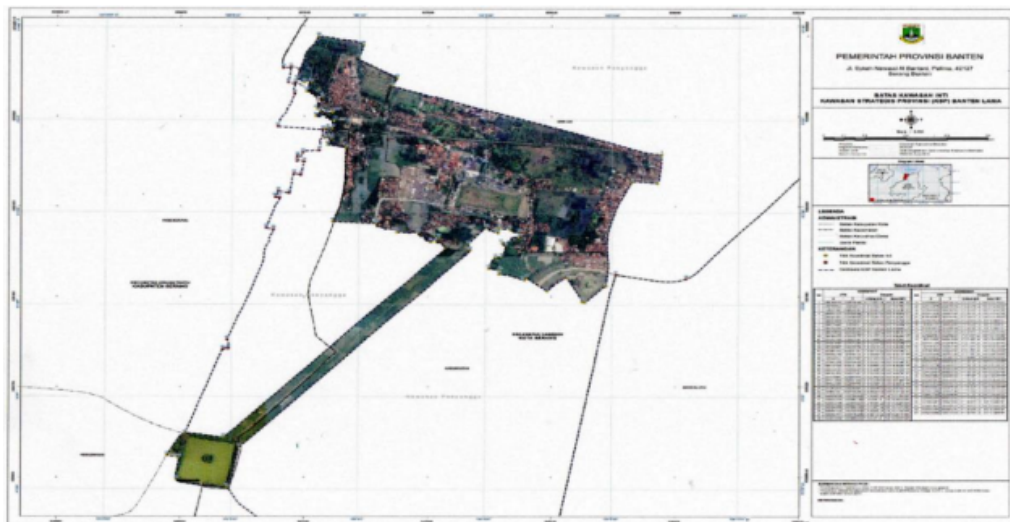
Gambar 2 Peta Batas dan Zonasi Kawasan Inti

Karangantu, Kabupaten Serang Timur : Kelurahan Sawah Luhur, Kecamatan Kasemen, Kota Serang